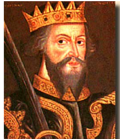
Guillaume le Conquérant